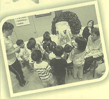
千コちゃんに群がる かわいい園児達