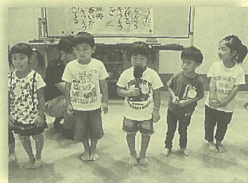
元気いっぱいの自己紹介