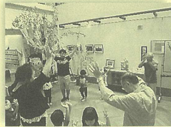
北上おでんせを踊りました